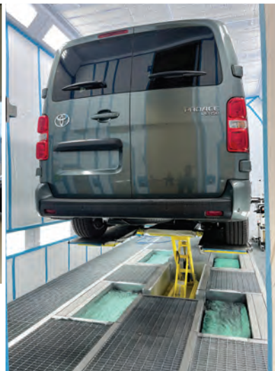
8 Kabinové zvedáky spolu se spodním osvětlením přispívají nejen k pracovnímu komfortu lakýrníků, ale i k vysoké kvalitě odvedené práce. ➤