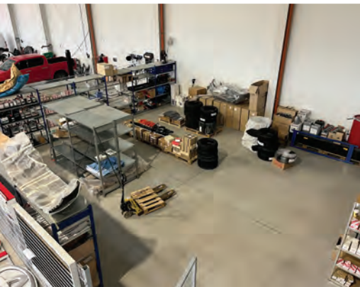
6 Součástí první haly je samostatný sklad náhradních dílů, umožňující nezávislý noční závoz.