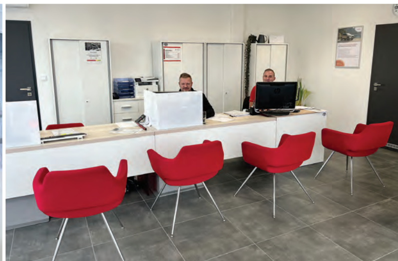
2 Zákaznický prostor pro příjem oprav.