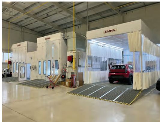
7 Dominantou druhé haly je technologický celek tří lakovacích kabin.